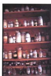
Laboratorio di ricerca al piano terreno