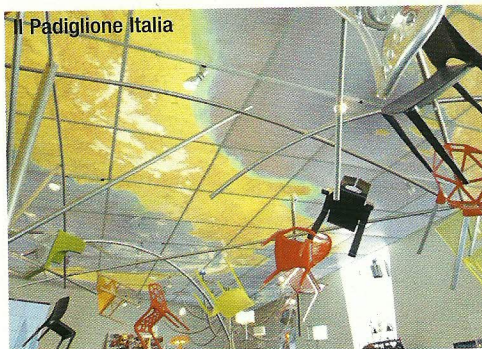
Il Padiglione Italia