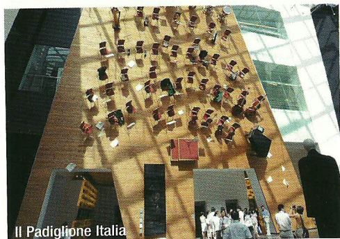
Il Padiglione Italia