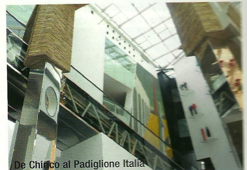
De Chirico al Padiglione Italia