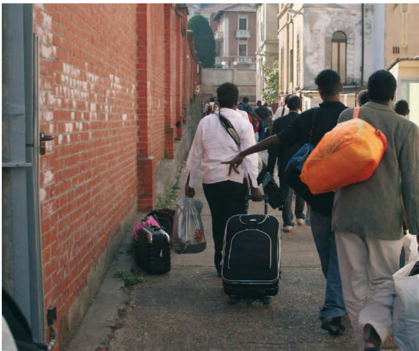
SENZA TREGUA La vicenda dei rifugiati per la terza volta finisce sotto la lente di ingrandimento dell'Onu e scatena le polemiche

Per Torino quello dei profughi è un incubo che non sembra conoscere fine, prima le polemiche per la sistemazione spontanea, una occupazione abusiva vera e propria dentro le sale operatorie dell'ex clinica di corso Peschiera, poi la ricerca di un tetto e la decisione dopo mesi di polemiche di ristrutturare i locali di un edificio militare per una spesa che si avvicina ai 300mila euro, infine una nuova occupazione nell'ex palazzina dei vigili in corso Chieri. E adesso come non bastasse arriva la beffa, un