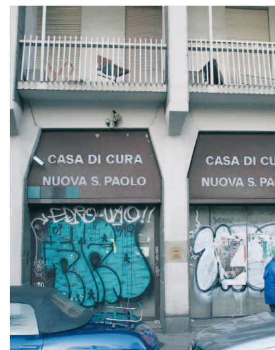
LAGHER I locali fatiscenti da dove erano partiti i profughi

hanno trovato ospitalità a Settimo presso le strutture della Croce Rossa, hanno trovato una casa e un lavoro. Ma non a Torino: in Valle di Susa, in un caso isolato più unico che raro, un immigrato è stato ospitato da una famiglia che gli ha affittato una parte della villetta dove ha trovato rifugio. Gli altri sono stati trasferiti in via Asti nella Caserma Lamarmora e dopo i tafferugli e uno sgombero tentato ma non riuscito e una permanenza durata ben oltre i sei mesi previsti dalla legge, per alcuni l'unica alternativa è stata l'occupazione abusiva guidata da una pattuglia di consiglieri di circoscrizione di Rifondazione comunista dentro l'ex caserma dei vigili di corso Chieri mentre altri si sono rifugiati dentro un edificio abbandonato di via Bologna e altri ancora sono tornati da dove erano venuti: la Casa Bianca dietro corso Peschiera, vicino alla clinica San Paolo, quella degli orrori.