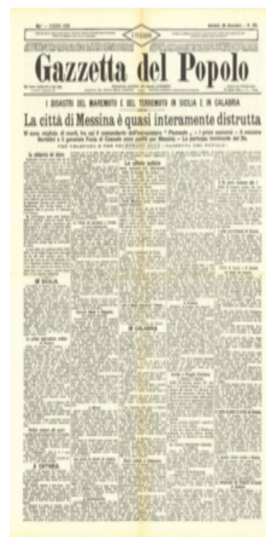
PRIMA PAGINA DELLA GAZZETTA 28 DICEMBRE 1908

Pertini diceva che «la memoria costruisce il futuro». E la Gazzetta del Popolo è l'unico fra i grandi giornali a non avere una monografia completa. «Questa mostra - sottolinea il suo curatore Luca Rolandi - dovrebbe avviare una digitalizzazione di tutti i 135 anni della sua storia. Uno spaccato, sull'Italia a cavallo tra '800 e '900, che non vuole ridursi ad una esposizione estemporanea bensì rappresentare il tentativo di dare futuro ad una memoria di un